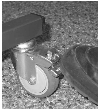
Afbeelding 2A: Op de rem zetten.