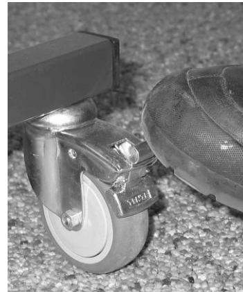
Afbeelding 2B: Van de rem zetten.

Attentie: Gebruik altijd minstens twee van de vier remmen.