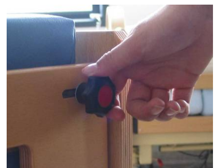
Afbeelding 3: Het kinderslot.